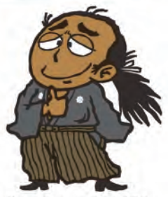
illustration : yasuhito SUMIYA